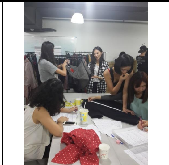
衡量網購商品尺寸