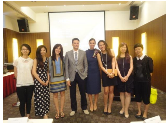
The MICAM 合照