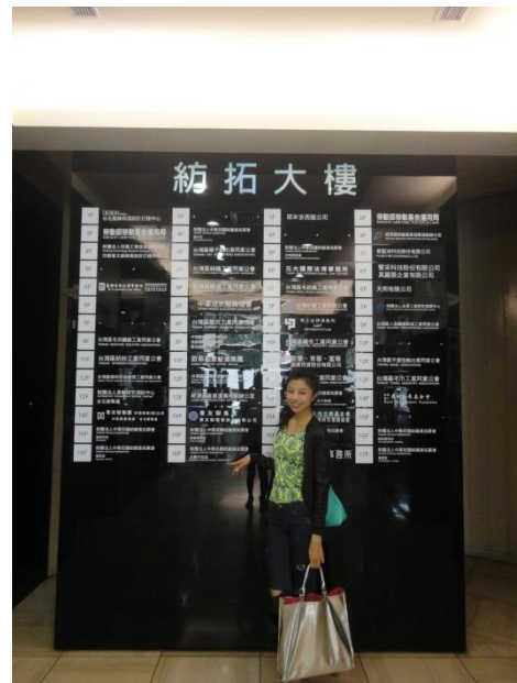
第一天紡拓大樓報到