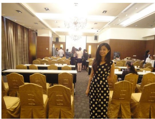
參與 the MICAM 說明會