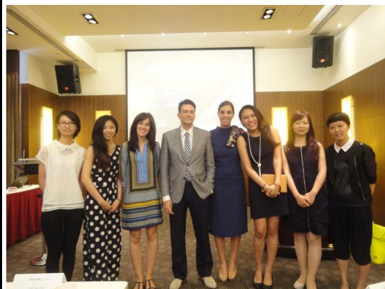
the MICAM 說明會主持人與主講人