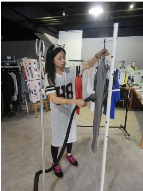
整燙 design+ 上架服裝