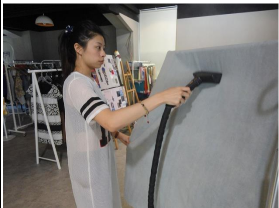
整燙活動場佈桌巾